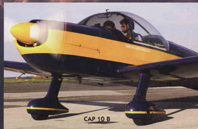
CAP 10 B

ARMOR AERO PASSION possède déjà un patrimoine étonnant. Le fleuron de notre parc aérien est le MORANE PARIS MS 760, unique exemplaire en état de vol en Europe. Pour l'aviation de loisirs, nous possédons également deux RALLYE MS 880B, dont le coût à l'heure de vol pour les membres de l'association est extrêmement attractif. Pour compléter cette flotte, un MUDRY CAP 10B permet de s'initier ou se perfectionner, avec des instructeurs confirmés, à la voltige aérienne.