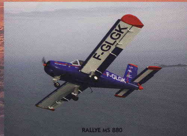
RALLYE MS 880